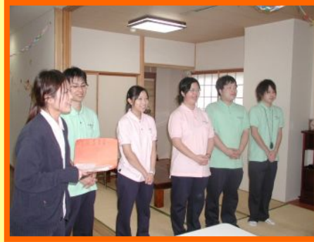
🕒 13:30 自己紹介 歌を歌ったり、季節にかけたり、ひと工夫を♪