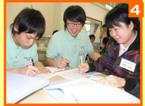
🕒 14:00~15:40 レクリエーション班・おやつ班に引継ぎ中に利用者記録を書きます