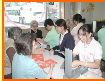
🕒 13:45 健康チェック 体温・脈拍・血圧を測定します