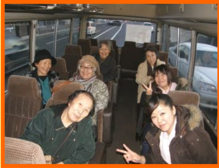
🕒 13:00 送迎出発 利用者様のご自宅へお迎え 🚌