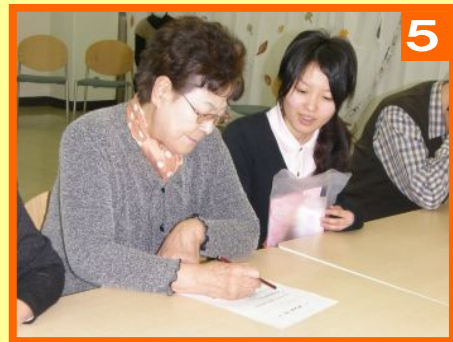
🕒 15:40 アンケート記入 今後のミニデイサービスに役立ちます 🍏