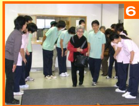
🕒 16:00 お見送り お越しいただき、本当にありがとうございました、(^▽^)/